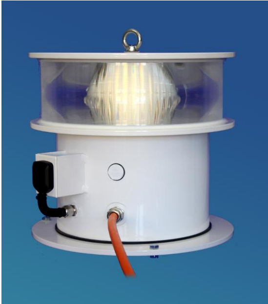
Darstellung mit integrierter Elektronik (Vorschalt elektronik, Dämmerungsschalter und GPS)